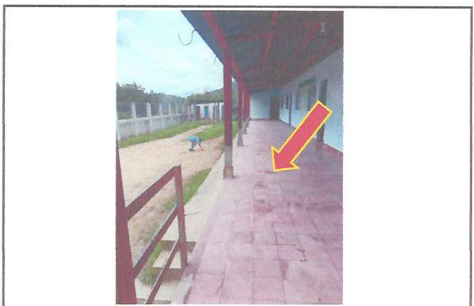
Foto 4: Se dara mantenimiento al piso del establecimiento ya que esta en mal estado.

Observación: Si es necesario se pueden agregar hojas adicionales y actualizar el número de hojas.