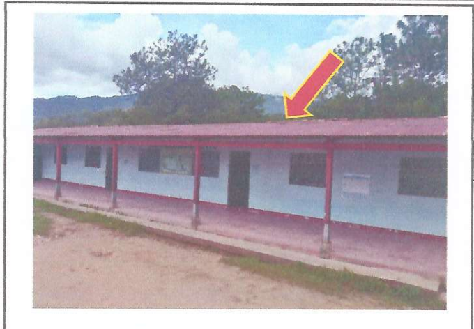
Foto 2: Se dara mantenimiento a la cubierta de lamina del establecimiento ya que por los años esta en mal estado con agujeros.