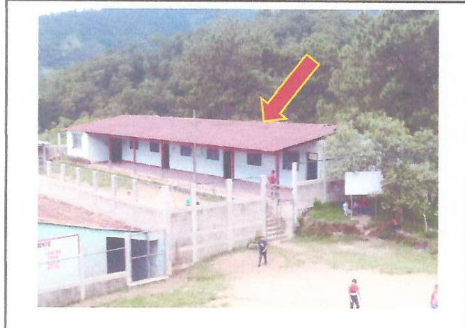
Foto1: Se dara mantenimiento a la cubierta de lamina del establecimiento ya que se encuentra en mal estado.